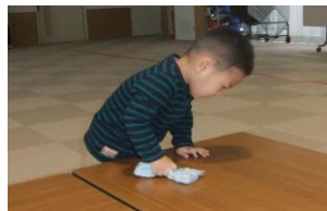
テーブルふきふき