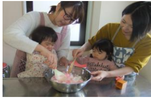
お手伝いがんばりました！ お母さんと一緒に♪