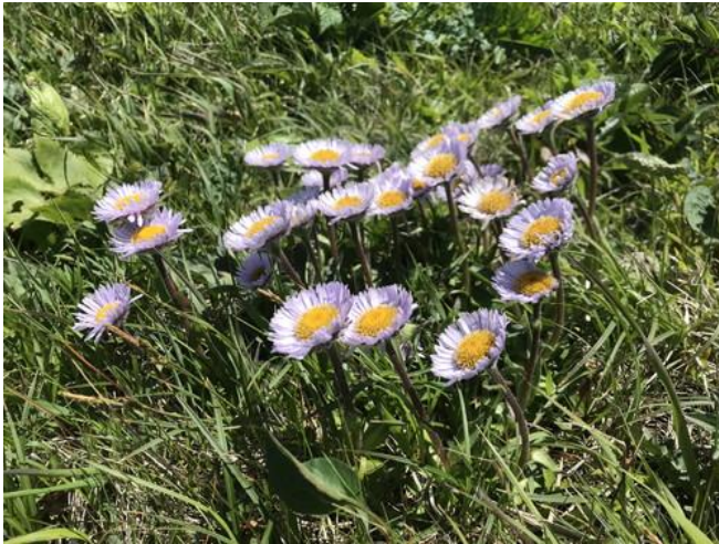
アポイ岳の固有な種のアポイアズマギクは、ミヤマアズマギクの変種