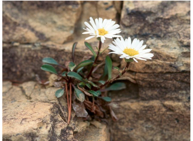
アポイアズマギクは、ミヤマアズマギクよりも、毛が少なく、葉も細い