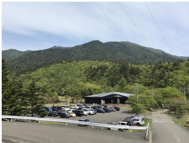
満車のビジターセンター前の駐車場