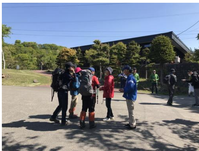
盗掘防止キャンペーンの様子

5/23（土）盗掘防止キャンペーンで約100人に啓発しました。 例年、5月中旬～6月中旬の休日のビジターセンター前の 駐車場は、天気が良ければ登山者の車で満車です。