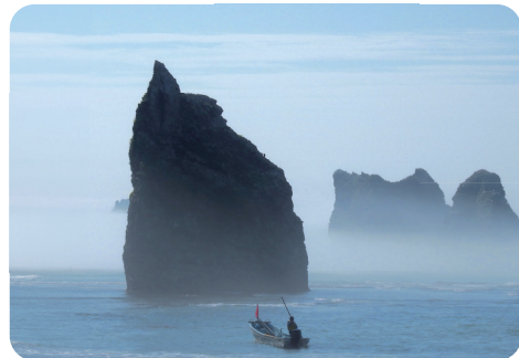
様似町のシンボル親子岩