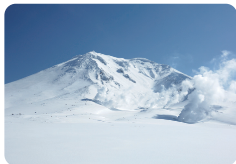
忠別ダムから見た旭岳

事前申し込み制・会員限定 参加費6,000円(昼食付)定員16名 9/25(水)までに北海道カメラ女子の会事務局(別紙チラシ)へ申し込み、参加料の支払手続きを行ってください。