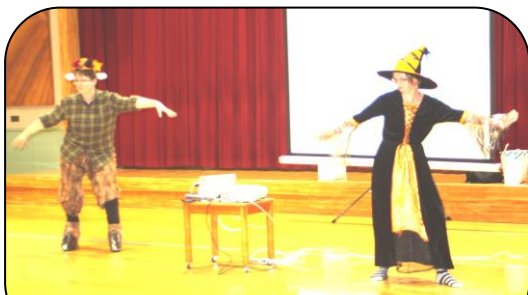
10/31 ハロウィンの踊りの様子

さて、11月18日(日)に第9回発表会を開催しました。3歳児、4歳児、5歳児クラスのどの子ども、たくさんの観客を前に練習の成果を見せてくれました。さっそく、20日(火)のホール集会で上手にできたことを誉めました。そして、「たくさん緊張しましたか?少し緊張しましたか?」と聞くと、たくさん緊張した子はあまりいませんでしたので、練習どおりの力を出せたのだと思います。4歳児クラスの保護者の連絡ノートに「本人は緊張の糸が切れてホッとしたりしく、車の中で大泣きしていました。でも、自分自身で当日の出来に花マルをあげれると言っていました。」と、4歳児でも自分の行動を冷静に判断できることにビックリさせられました。その他にも「楽しかった〜、もう一回やりたい!」と言っていました」や「4歳児は3歳児の時よりも、5歳児は4歳児の時よりも、子どもの成長を感じられる発表会でした」など多くの感想をいただきありがとうございました。昨年書かせていただきましたが、「学び」というものは、脳の物質であるドーパミンをたくさん出してあげることが大事で、初めてできたことが「たのしい」「うれしい」と思うことで強化され、ドーパミンがたくさん出ることが学びに繋がっていくそうです。子ども達も家族に「上手だったよ」と誉められたと話していました。この学びが来年に繋がっていくと思います。発表会にあたり保護者の方にも沢山お手伝いをいただきました。ありがとうございました。