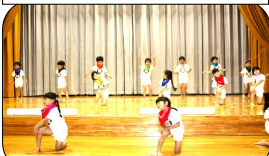
11/19発表会 リトミックなわとび(5歳児)