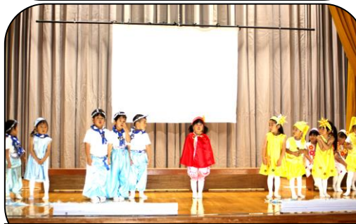
11/19発表会 劇 北風と太陽(4歳児)