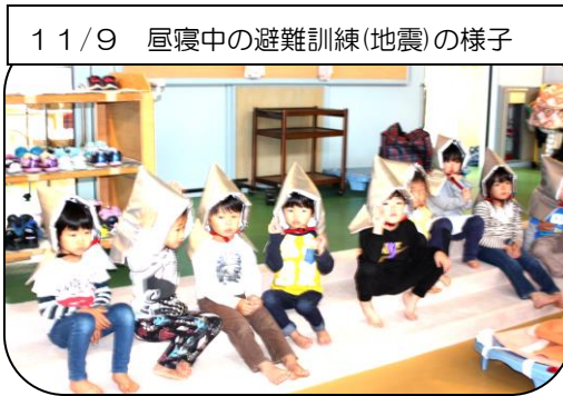
11/9 昼寝中の避難訓練(地震)の様子