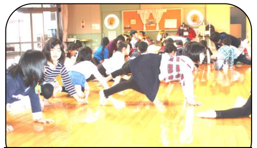
11/20運動あそびの様子(片足くまさん)