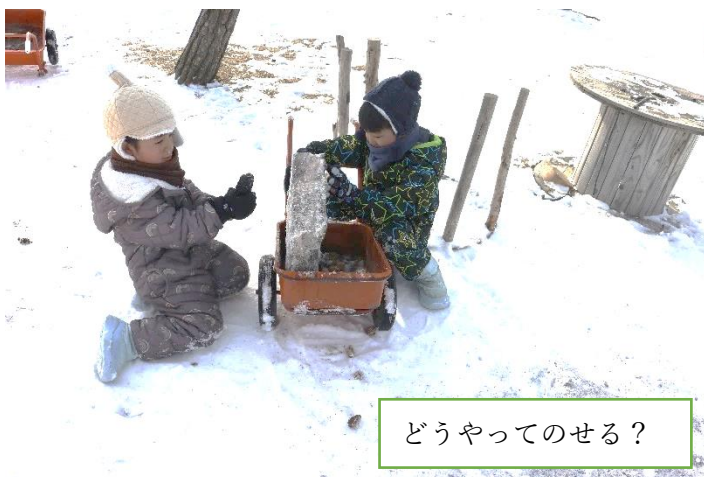
どうやってのせる？