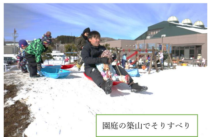
園庭の築山でそりすべり