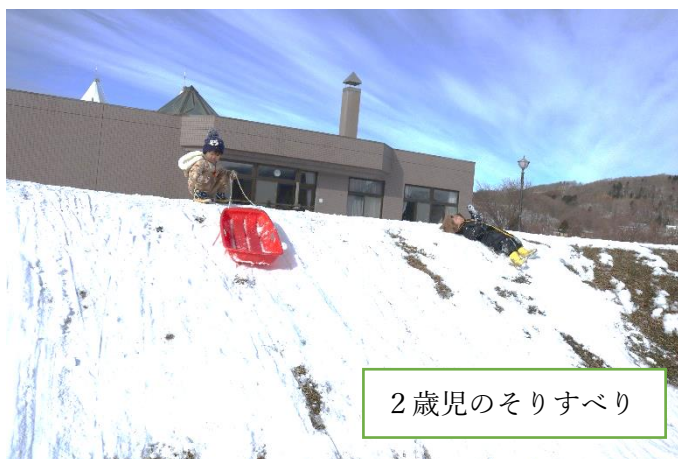
2歳児のそりすべり