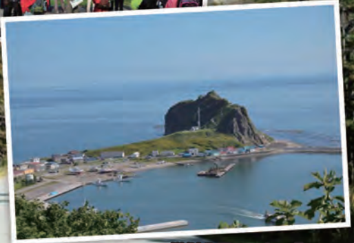
△様似八景のひとつ「エンルム岬」