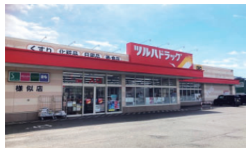
ツルハドラッグ様似店

令和8年5月より、AEDを町内2か所の店舗(ツルハドラッグ様似店、セブンイレブン様似大通2丁目店)に設置しました。