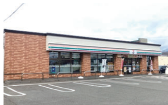
セブンイレブン様似大通2丁目店