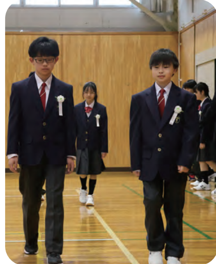
▼4月7日(火) 様似中学校