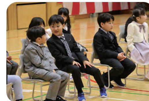
▼4月7日(火) 様似小学校