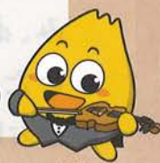
北ガス マスコットキャラクター 「てん太」くん