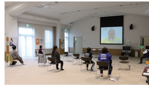
通いの場かみかみ百歳体操