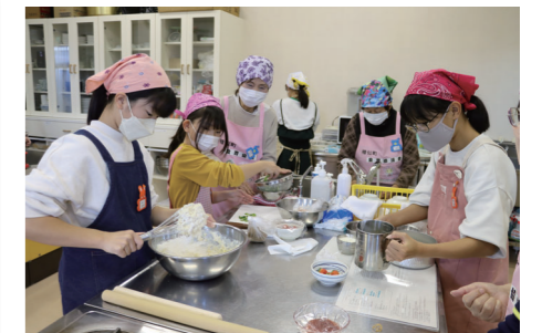
(11月13日) 子ども料理教室の様子