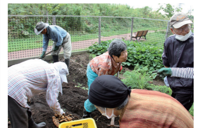
エンルム農園で収穫作業