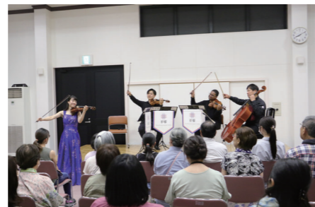
演奏後の決めポーズ！

国内はもとより本場吹奏でも喝采を浴び、国際的評価を得ている都響。震災後から毎年、村で演奏会を開催しています。会場は演奏を待ち望んだ来場者で満席となり、プロ奏者の美しく、力強い音色に酔いしれました。