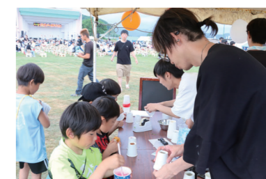
↑火まつりでの科学実験ブース