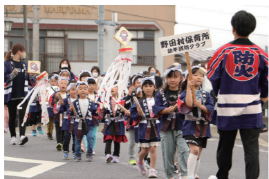
堂々と行進しました！

村中心街では、消防団の分列行進前に、村内各保育所の園児で構成される幼年消防クラブが行進をしました。見学していた住民は、大きな声で火の用心を呼び掛ける園児の姿に、防火意識を高めました。