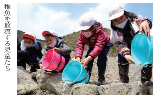
稚魚を放流する児童たち

4月15日(木)、野田小学校の恒例行事の「サケ稚魚放流」が開催され、同2年生の児童35名が放流を行いました。この行事は、下安家漁業協同組合のふ化施設内で毎年開催されるもので、放流したサケの稚魚は4年の月日を経て成魚となって故郷の野田村へ帰ってきます。 児童たちは「4年後に帰ってきたサケにまた会いたい」と稚魚たちを愛おしそうに見送りました。