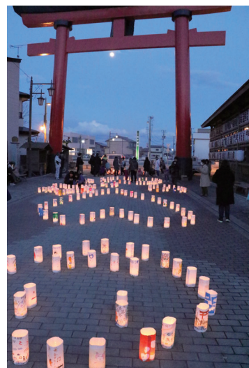
▲一つひとつメッセージやイラストが書かれた夢あかり

3月11日、東日本大震災の犠牲者への追悼と復興支援に対する感謝の思いを込めた夢あかりが愛宕参道広場で行われました。