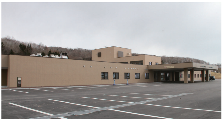
ソビラ荘 管理棟(北西側から撮影)