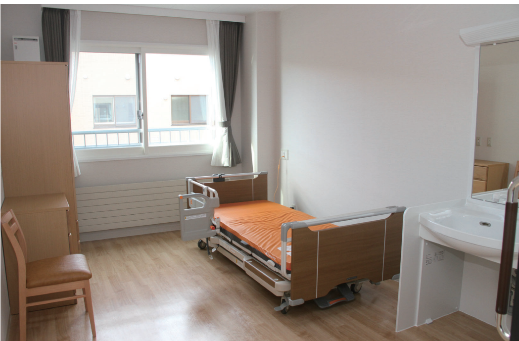
ソビラ荘 ユニット棟 居室