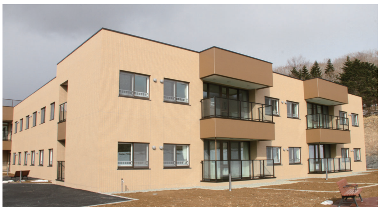
ソビラ荘 ユニット棟 (南西側から撮影)