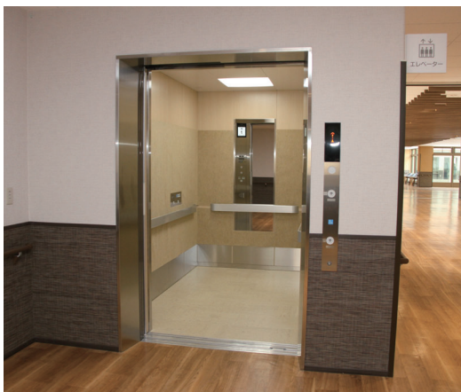
エレベーター(建物内2基設置)