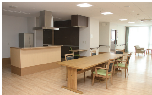
各ユニット 共同生活室