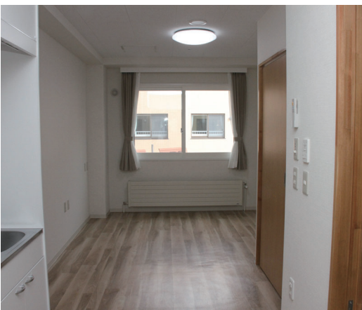
エンルム荘 居室(1人部屋)