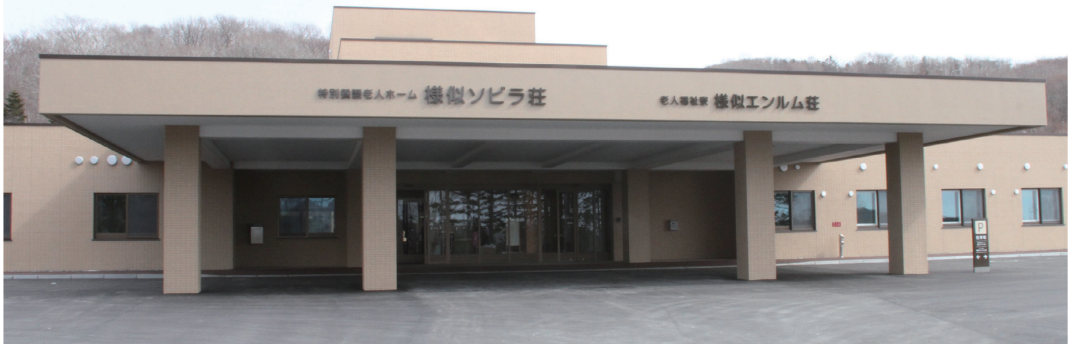
ソビラ荘・エンルム荘 正面玄関