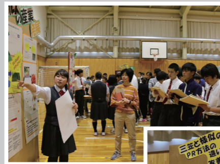
プレゼンテーション能力が試されます

中学生と小学6年生が、興味深い内容のポスターとなっているか、わかりやすい説明となっているかを観点に投票したものを基に審査を行い、代表となった1グループは11月に大分で行われる第10回日本ジオパーク全国大会2019 おおいた大会のポスターセッションで発表します。