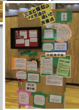
見やすく工夫されたポスター