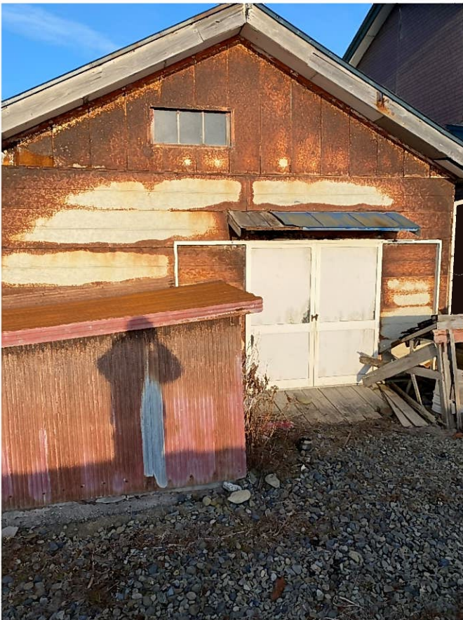
附属家 (倉庫) ↑